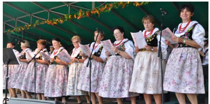
Na scenie gospodynie z KGW Janowice