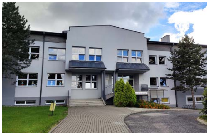
Przedszkole i biblioteka w Bestwinie