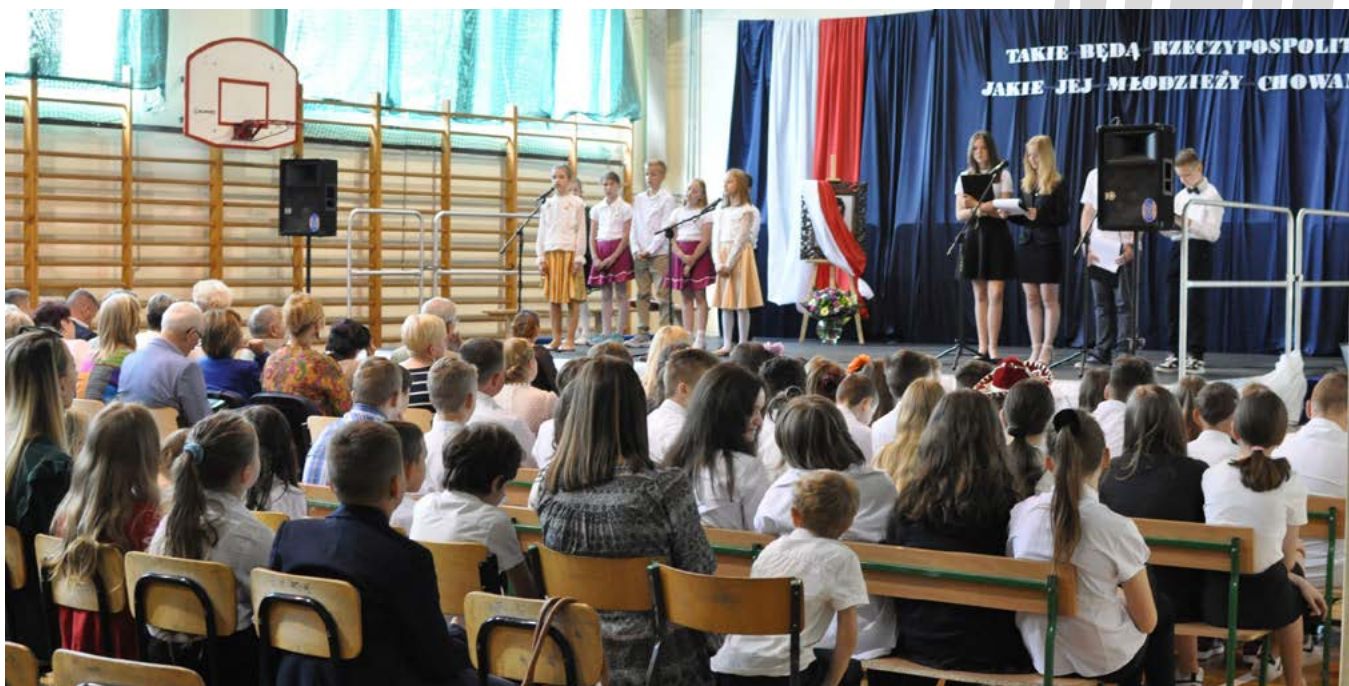
30 lat szkoły w Bestwinie

W roku szkolnym 2023/2024 naukę w placówkach oświatowych gminy Bestwina pobierało ok. 1600 osób. W tym gronie są uczniowie szkół podstawowych, przedszkolaki i maluchy z klubu dziecięcego Puchatek . Ten ostatni został otwarty w Kaniowie w lutym 2021 r. i pełni rolę żłobka dla najmłodszych. W ciągu ostatniej kadencji obiekty edukacyjne były remontowane i wyposażane tak, aby nauczyciele i podopieczni spędzali wspólnie czas w warunkach jak najbardziej komfortowych, z dostępem do pomocy naukowych. W Bestwinie, Bestwinie, Janowicach i Kaniowie działają Zielone Pracownie wyposażone w sprzęt przydatny do przedmiotów przyrodniczych. Program Dostępna Szkoła umożliwił przystosowanie budynków do potrzeb osób niepełnosprawnych, zaś place zabaw, stacje pogodowe, ekosłupki, ogródki czy budki dla ptaków dopełniają bogaty obraz całości. Gmina Bestwina w okresie pandemii koronawirusa pomagała w organizacji edukacji zdalnej , zapewniając w ramach specjalnego projektu laptopy pomocne w zdobywaniu wiedzy w warunkach domowych.