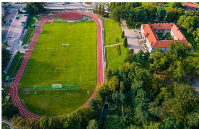
Stadion LKS Bestwina i bieżnia

UKS Wojownik Bestwina – klub szkolny działający przy ZSP im. św. Jana Kantego. Osiągał on sukcesy w sportach walki (karate), znany jest z organizacji Memoriału im. Anny Krystyan i wakacyjnych wyjazdów kolonijnych.