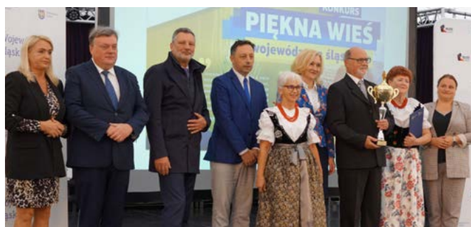
Kaniów najpiękniejszy w województwie śląskim