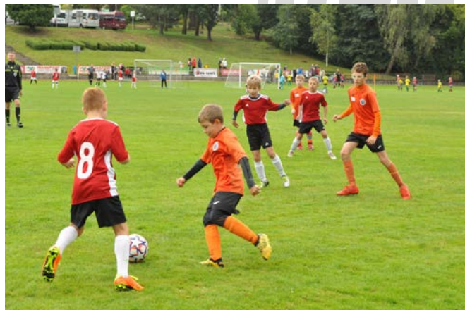
Turniej „Piłkarskich Janków”