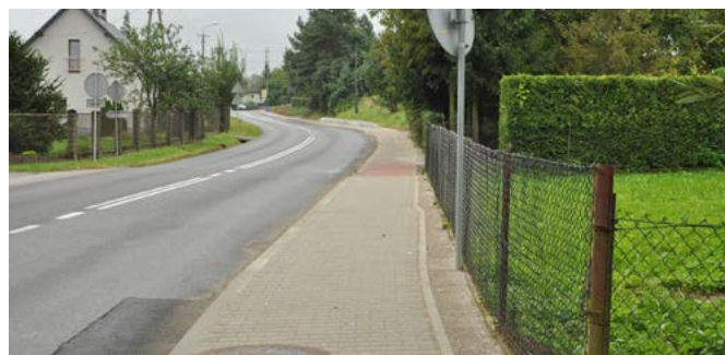
Bestwina – chodnik przy ul. Witosa

Bestwinka: przebudowa ul. Sportowej; remonty ul. Rzecznej i Starowiejskiej; przebudowa układu komunikacyjnego na skrzyżowaniu ul. św. Sebastiana, Dworkowej i św. Floriana (ZDP), remont ul. Olchowej i św. Floriana (ZDP); montaż progów zwalniających na ul. Podpolec; budowa doświetlenia przejść dla pieszych na ul. Witosa; oświetlenie ul. Braci Dudów, Dworkowej, Długiej.