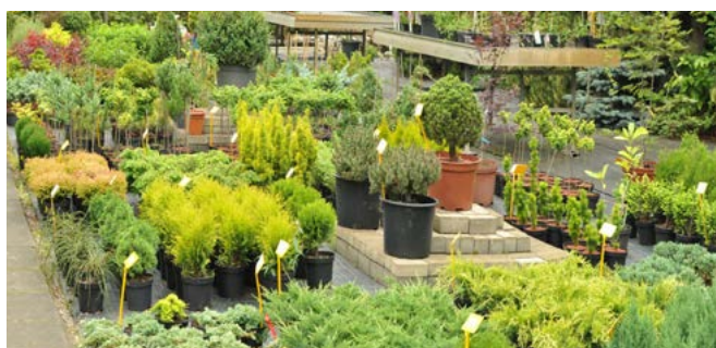
Szkółka „Greń” z Bestwinki – trzecie miejsce w konkursie wojewódzkim