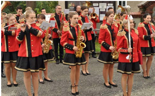
Orkiestra Dęta Gminy Bestwina z siedzibą w Kaniowie