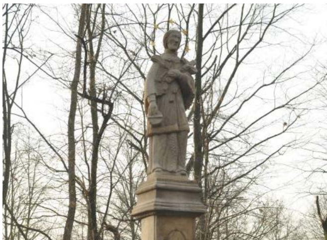
Figura św. Jana Nepomucena w Bestwinie