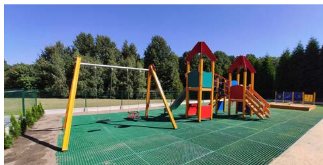
Plac zabaw w Janowicach

Tereny rekreacyjne za siedzibą OSP – na miejscu estrada, zaplecze do organizowania imprez plenerowych, plac zabaw dla dzieci, siłownia zewnętrzna. Jest to punkt startu Janowickich Rajdów Rowerowych.