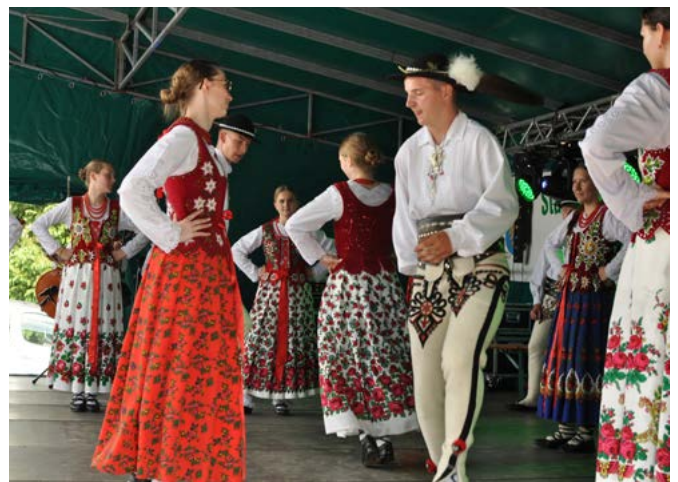
Laski uOzgraj – Bestwińskie Spotkania Folklorystyczne