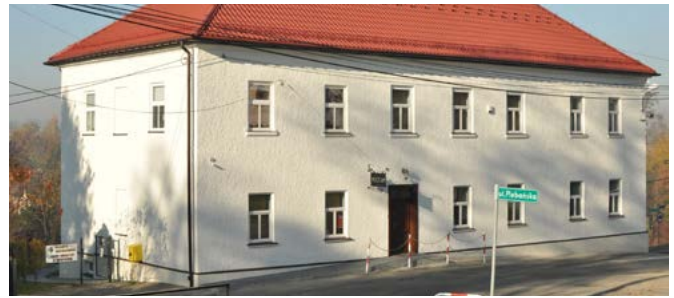
Muzeum Regionalne w Bestwinie

Bestwinka: remont szkoły z programu Dostępna Szkoła; termomodernizacja budynku OSP Bestwinka; remont dachu KS Bestwinka i wykonanie nawodnienia boiska klubowego.