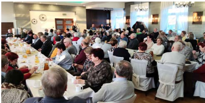
Klub Seniora w Bestwinie