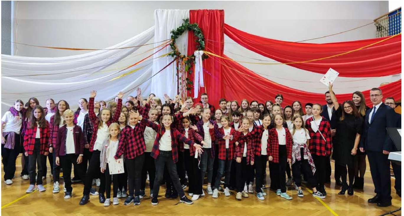
Gminny Festiwal Pieśni Patriotycznej

Szerokim echem w roku 2023 odbyły się w gminie dwie duże uroczystości – 30 lat Szkoły Podstawowej w Bestwince , połączone z nadaniem placówce imienia Zbigniewa Pietrzykowskiego i nadanie sztandaru SP im. Tadeusza Kościuszki w Kaniowie . Zgromadziły one wielu gości, dawni absolwenci wspominali swoje własne lata spędzone w szkolnych ławach.