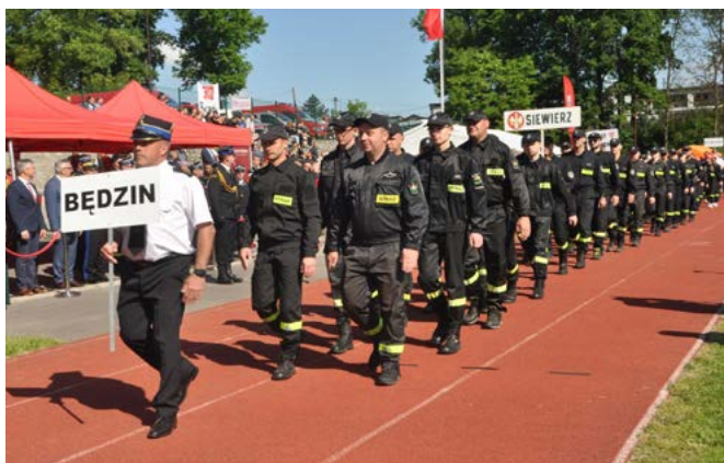
Wojewódzkie zawody sportowo-pożarnicze