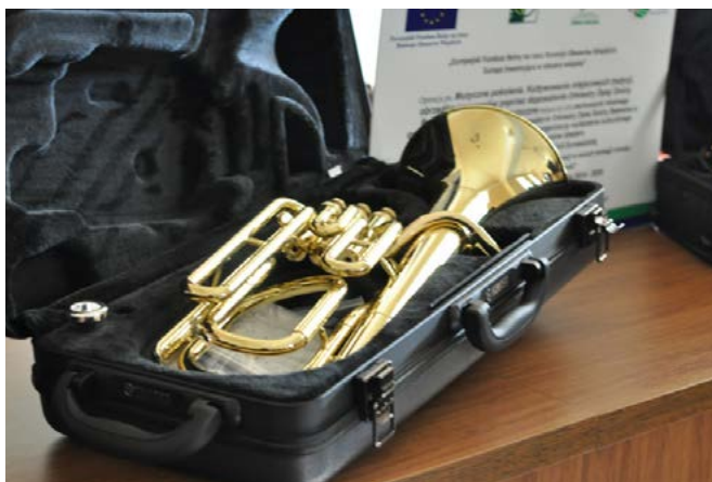
Instrumenty zakupione dla Orkiestry Dętej