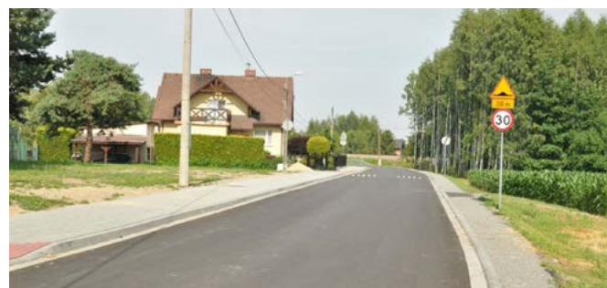
Bestwinka – ul. Sportowa

Janowice: remonty ul. Granicznej, Pszczelarskiej, Miodowej (I etap); remont i budowa chodnika w ciągu ul. Janowickiej do granicy z miastem Bielsko-Białą; remont drogi dojazdowej do terenów rekreacyjnych wraz z brukowaniem na terenach rekreacyjnych; budowa oświetlenia przy ul. Janowickiej; doświetlenie przejść na pieszych przy ul. Janowickiej; remont parkingów przy OSP Janowice; remont przepustu w ciągu ul. Kubika (ZDP); remont ul. Górskiej (ZDP).