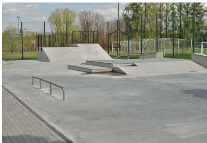
Skatepark – tereny rekreacyjne w Kaniowie