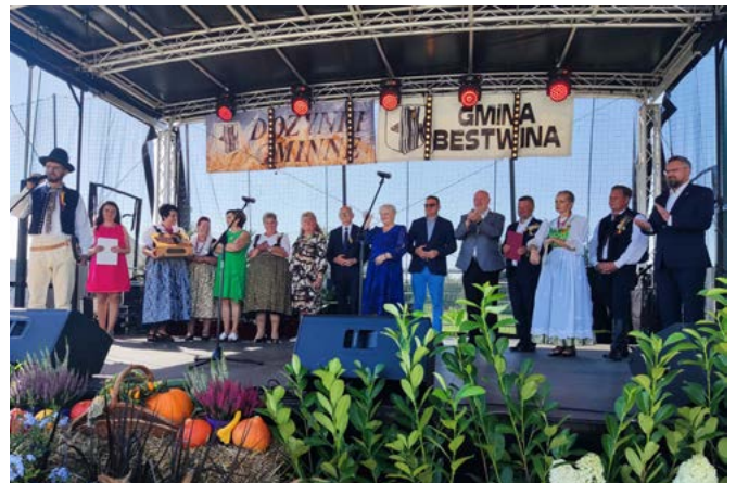
Dożynki gminne w Bestwinie