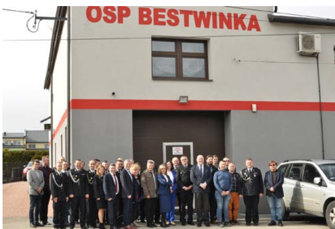
Otwarcie Domu Strażaka w Bestwinie po termomodernizacji

Ochotnicze Straże Pożarne prowadzą szeroko zakrojoną działalność edukacyjno-szkoleniową, zabezpieczają imprezy plenerowe, są obecne na każdej uroczystości gminnej, państwowej i kościelnej. Aktywnie współpracują z innymi organizacjami społecznymi. Inwestując w OSP – inwestujemy w samych siebie. Nie ma lepszej polisy ubezpieczeniowej, niż zawsze przygotowani do walki o nasze bezpieczeństwo – druhowie.