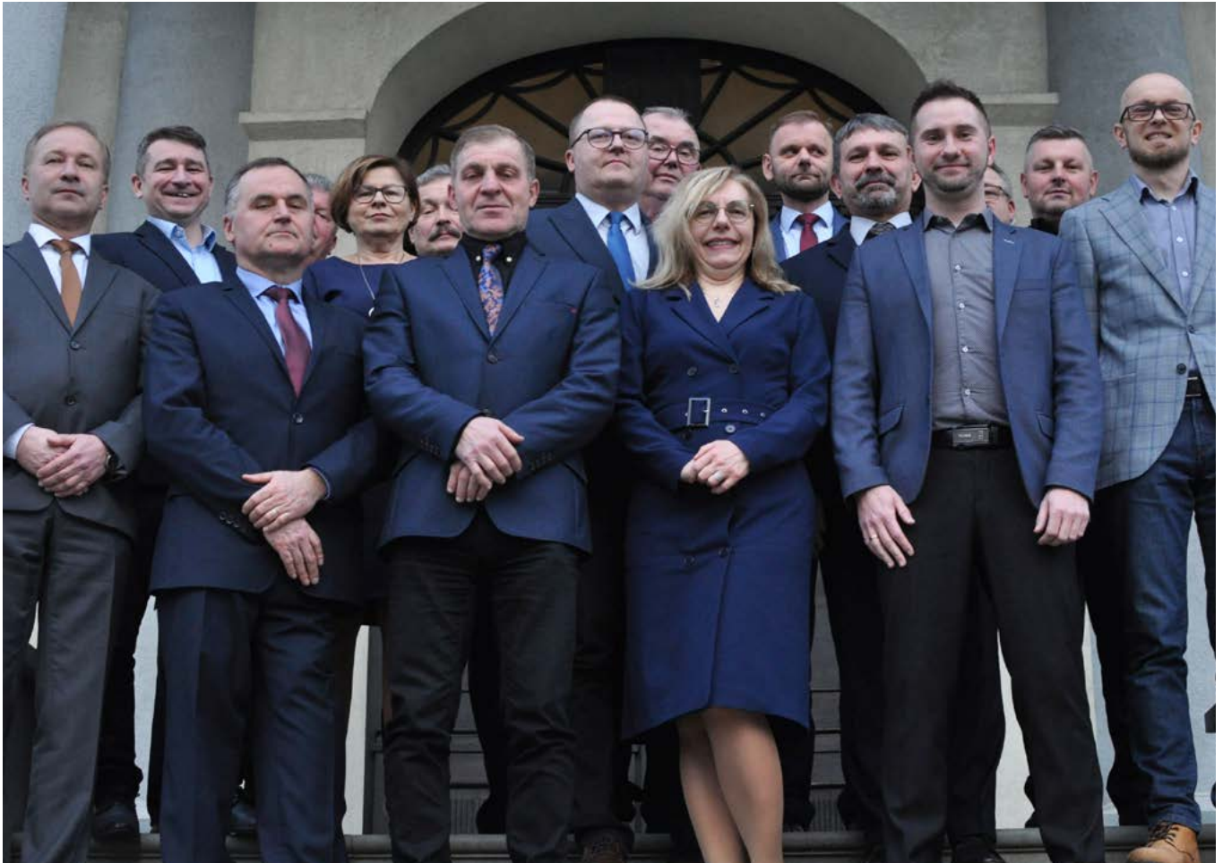
Rada Gminy Bestwina 2018–2024