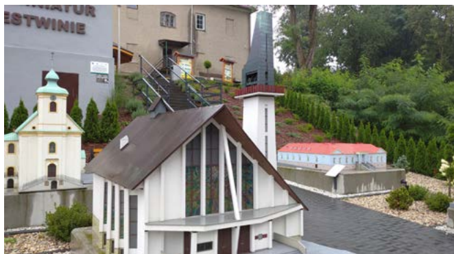
Park Miniatur w Bestwinie