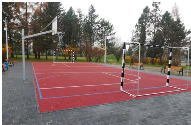
Boisko wielofunkcyjne w Kaniowie

Kompleks sportowy LKS Przełom Kaniów , na który składają się boisko główne z krytą trybuną i tablicą świetlną, boisko treningowe, budynek klubowy, spikerka. Infrastruktura klubowa w ostatnich latach została odnowiona staraniem władz klubu, urzędu gminy, sponsorów i kibiców.