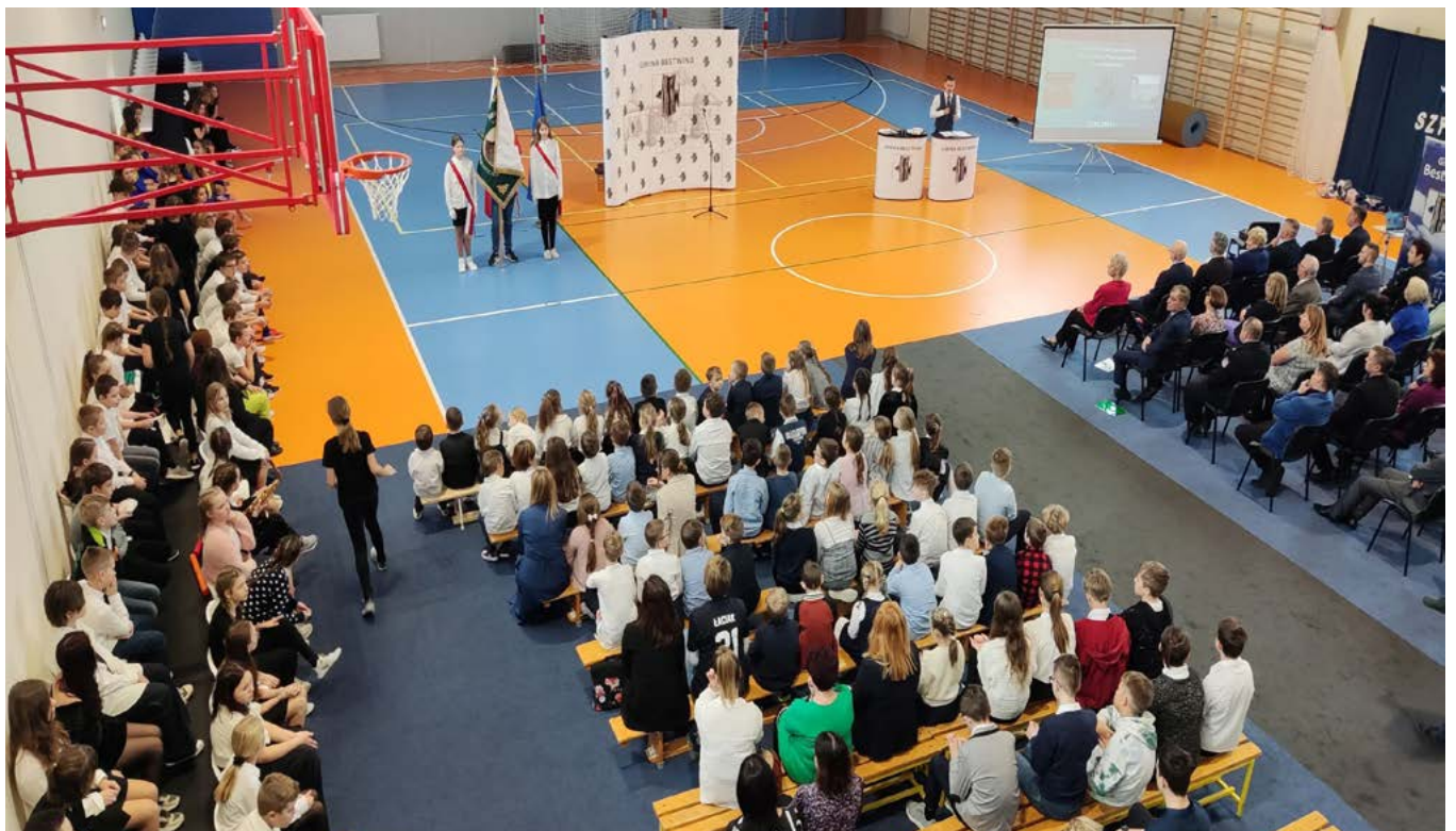
Otwarcie zgromadziło gości i społeczność szkolną