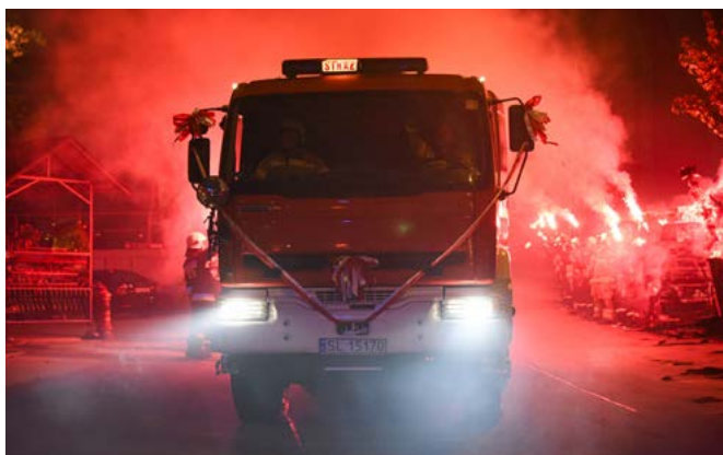
Powitanie samochodu Renault Kerax w OSP Bestwina