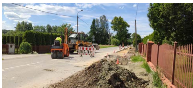
Budowa chodnika przy ul. Janowickiej