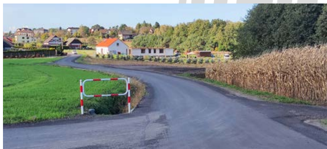
Janowice i Bestwina – ul. Graniczna po odbudowie

Bestwina: remonty ul. Okrężnej, Podzamcze, Granicznej, Świerkowej, Starowiejskiej, Krakowskiej (Zarząd Dróg Powiatowych), Górskiej (ZDP); budowa i remont chodnika przy ul. Witosa; montaż progów zwalniających przy ul. Buczyzna; zatoka autobusowa przy Urzędzie Gminy; budowa wyniesionego przejścia przy ul. Podzamcze wraz z oświetleniem; oświetlenie przejść dla pieszych – ul. Krakowska i ul. Szkolna; wykonanie oświetlenia ul. Dolnej, Ofiar Wojny, Maków, Chabrowej, Plebańskiej, Brzozowej, Górskiej.