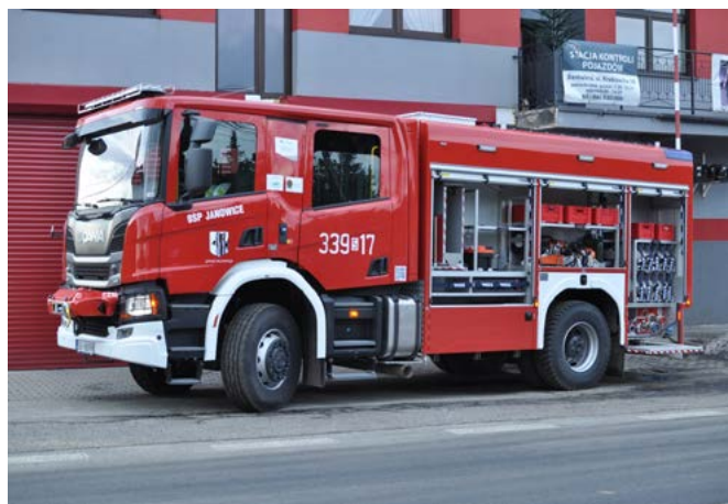
Średni samochód Scania P360 – OSP Janowice