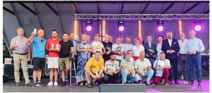
Święto Karpia Polskiego w Kaniowie

pikniki, zawody, festyny. Dobrze układa się współpraca z Powiatowym Ogniskiem Pracy Pozaszkolnej Art. Do wiodących mecenasów kultury należą parafie katolickie; tutaj w pierwszym rzędzie trzeba wymienić kościół Wniebowzięcia NMP w Bestwinie z renesansowymi malowidłami, epitafium Myszkowskich i dzwonem Król Chwały – jest to zabytek na skalę ogólnopolską, odwiedzany przez turystów i opisywany w różnorodnych publikacjach. Dbałość o zabytki w gminie Bestwina uwidacznia się także poprzez odnawianie figur i kapliczek przydrożnych (św. Jan Nepomucen, Archanioł Michał, Chrystus cierpiący, krzyż przy kościele w Kaniowie).