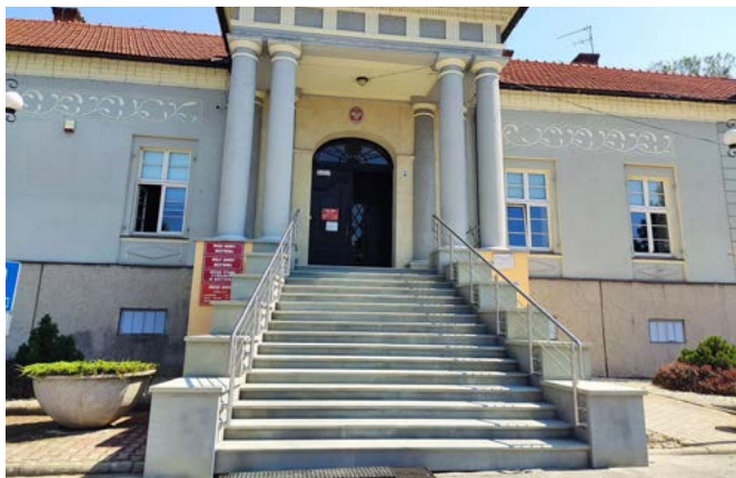
Główne wejście do Urzędu Gminy

Bestwina: termomodernizacja budynku przedszkola; budowa bieżni i oświetlenia przy boisku LKS Bestwina; wymiana nawierzchni placu zabaw na terenach rekreacyjnych; remont szkoły w ramach programu Dostępna Szkoła; wykonanie elewacji Muzeum Regionalnego; Pasieka Słowiańska i Park Miniatur przy Muzeum; remont schodów do Urzędu Gminy; wymiana nawodnienia boiska LKS Bestwina, montaż piłkochwyłów.