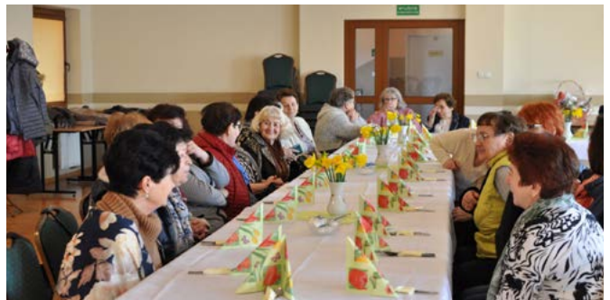
Zebrań KGW w Kaniowie