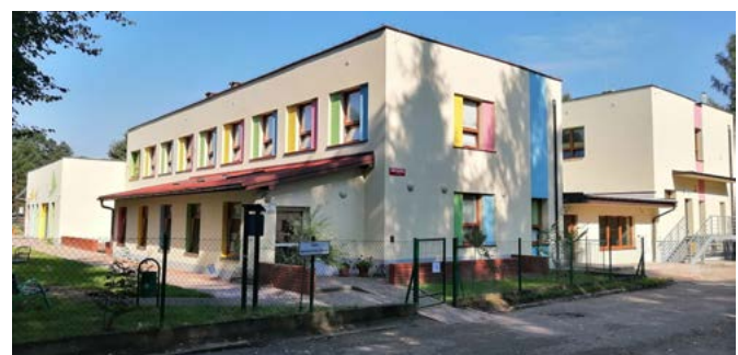
Przedszkole i klub dziecięcy w Kaniowie

Kaniów: budowa klubu dziecięcego wraz z rozbudową przedszkola; remont szkoły z programu Dostępna Szkoła; budowa skateparku, boiska wielofunkcyjnego i placu zabaw na terenach rekreacyjnych; naprawa części ogrodzenia i placu wewnętrznego przy LKS Kaniów.