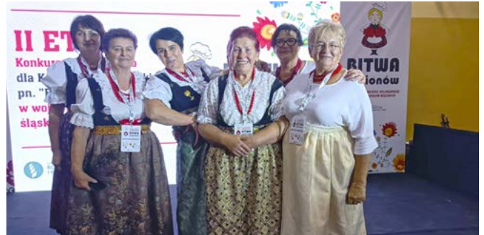
„Bitwa Regionów” – Nakło Śląskie

Również Kluby Seniora działają coraz bardziej dynamicznie – członkowie i członkinie wyjeżdżają na wycieczki krajowe i zagraniczne, spotykają się z okazji Dnia Kobiet, Barbórki, andrzejek. Przyznawane są nagrody dla najaktywniejszych seniorów, a cykliczne jubileusze działalności są okazją do wspomnień i do ocalenia od zapomnienia wielu interesujących informacji.