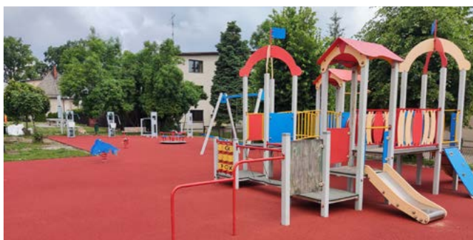
Plac zabaw w Bestwinie