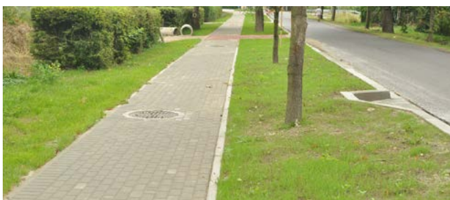
Kaniów – Chodnik przy ul. Dankowickiej

Bestwinka: przebudowa ul. Sportowej; remonty ul. Rzecznej i Starowiejskiej; przebudowa układu komunikacyjnego na skrzyżowaniu ul. św. Sebastiana, Dworkowej i św. Floriana (ZDP), remont ul. Olchowej i św. Floriana (ZDP); montaż progów zwalniających na ul. Podpolec; budowa doświetlenia przejść dla pieszych na ul. Witosa; oświetlenie ul. Braci Dudów, Dworkowej, Długiej.