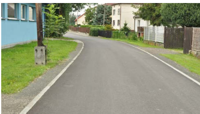
ul. Mirowska w Kaniowie

Janowice: remonty ul. Granicznej, Pszczelarskiej, Miodowej (I etap); remont i budowa chodnika w ciągu ul. Janowickiej do granicy z miastem Bielsko-Białą; remont drogi dojazdowej do terenów rekreacyjnych wraz z brukowaniem na terenach rekreacyjnych; budowa oświetlenia przy ul. Janowickiej; doświetlenie przejść na pieszych przy ul. Janowickiej; remont parkingów przy OSP Janowice; remont przepustu w ciągu ul. Kubika (ZDP); remont ul. Górskiej (ZDP).