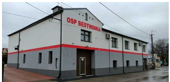
Strażnica OSP w Bestwinie

Bestwinka: remont szkoły z programu Dostępna Szkoła; termomodernizacja budynku OSP Bestwinka; remont dachu KS Bestwinka i wykonanie nawodnienia boiska klubowego.