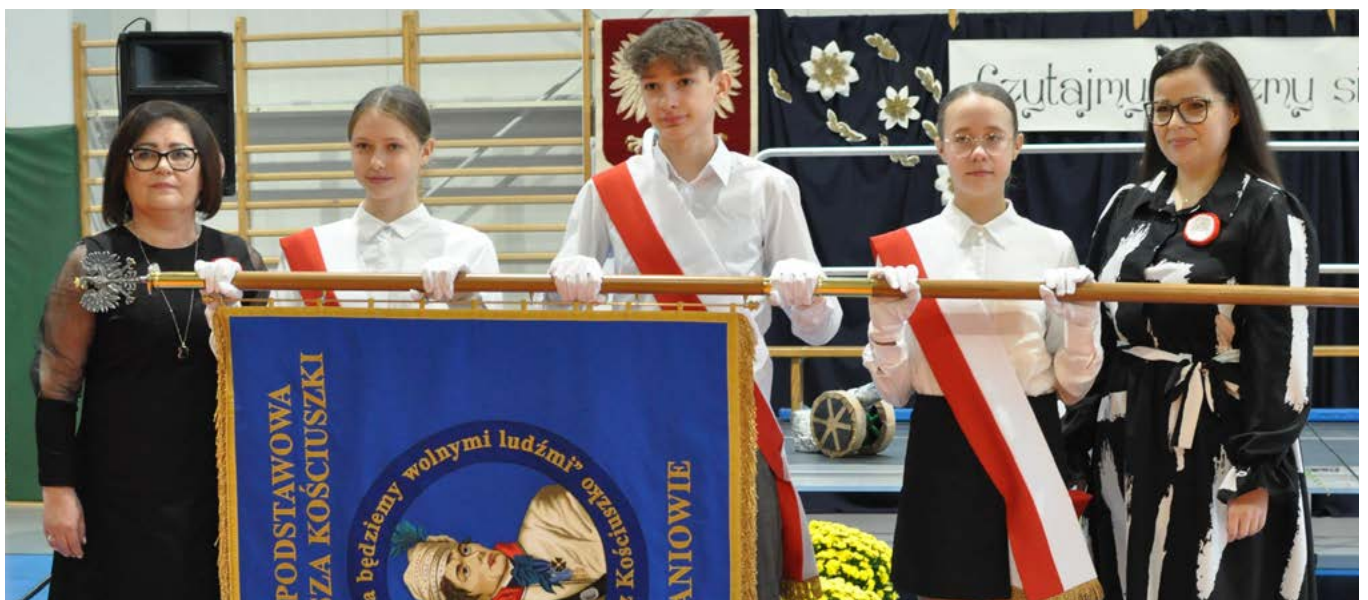
Sztandar szkolny SP Kaniów