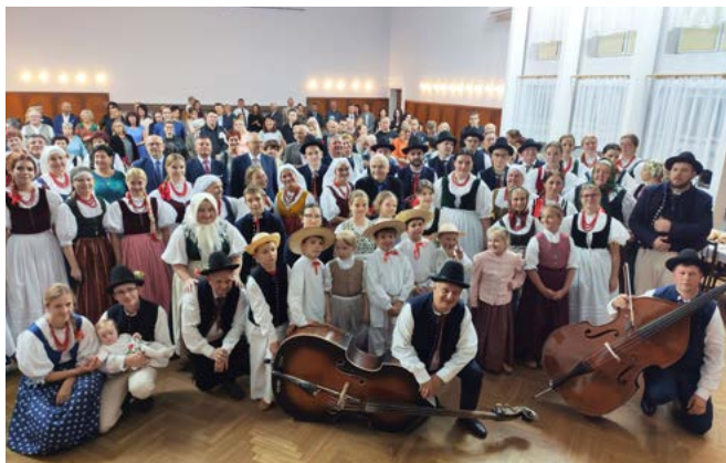
Regionalny Zespół Pieśni i Tańca „Bestwina”

W Muzeum Regionalnym im. ks. Bubaka można odwiedzić wystawy stałe (Józefowa Izba, Piykno Izba, wozownia, część sakralna, pracownia dziejów wsi) oraz ekspozycje czasowe. Na zewnątrz mieszczą się Pasięka Słowiańska i park miniatur. Muzeum prowadzi lekcje dla dzieci i młodzieży, jest siedzibą Towarzystwa Miłośników Ziemi Bestwińskiej . Użycza swoich pomieszczeń bestwińskiej grupie artystów plastyków Jaskółka .